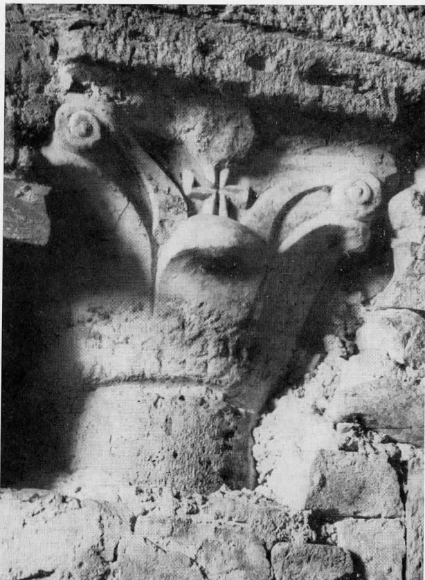
FIG. 4 - CAPITELLO DI UNA COLONNETTA DELLA CRIPTA

Gran parte di queste volte recano ancora, sull'antico intonaco, una decorazione pittorica costituita da motivi floreali.