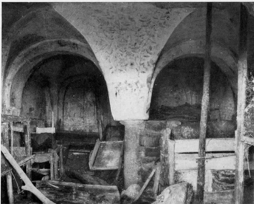
FIG. 3 - UNA PARTE DELLA CRIPTA CON ANTICHE DECORAZIONI SULLE VOLTE

Le pareti perimetrali presentano un serrato susseguirsi di arcate cieche e di pilastri schiacciati, a più riseghe, sui quali s'impostano arcate che vanno ad appoggiarsi ai capitelli delle colonnette della parte centrale, mentre dalle riseghe nascono, senza interruzione, gli spigoli delle volte a croce.