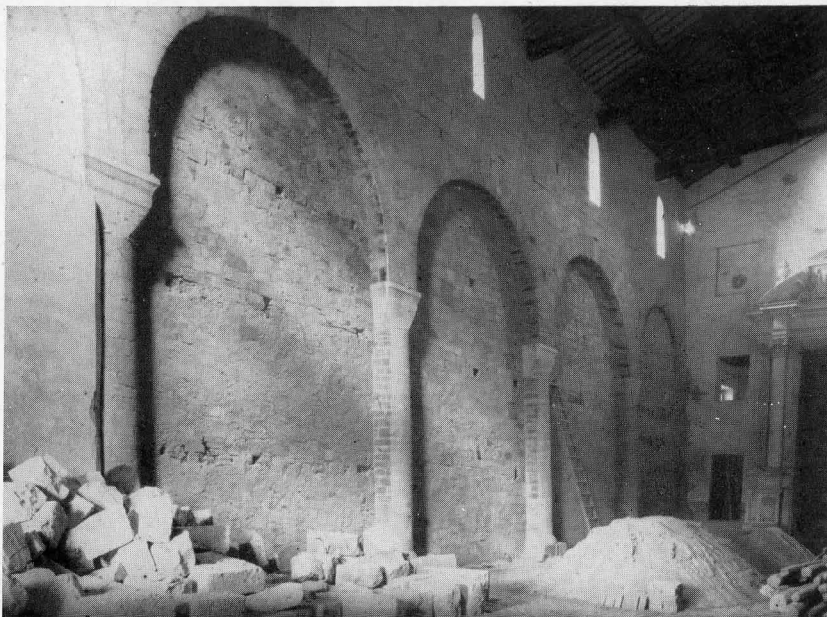
FIG. 2 - NAVATA CENTRALE: LATO SINISTRO CON LE ARCHEGGIATURE TORNATE ALLA LUCE

Dai rilievi sommari eseguiti — maggiore esattezza non è stata possibile dato l'ingombro costituito dai materiali più disparati — parrebbe ragionevole trattarsi di una cripta a sette navatelle di due campate ciascuna, due in corrispondenza delle navate minori e occupanti l'ultima grande campata presbiteriale e tre sottostanti alla medesima parte della navata maggiore. Restano sufficienti tracce per stabilire che anticamente la cripta fu absidata nella parte centrale ed è probabile la contemporanea presenza di due absidi minori. Questa cripta, della quale rimangono in piedi ben cinque delle originarie sette navatelle, ebbe pianta di forma rettangolare e, caso rarissimo, occupò l'intera larghezza della chiesa, mentre in genere le cripte abbaziali della zona, tranne il caso di quella di S. Salvatore al Monte Amiata, si