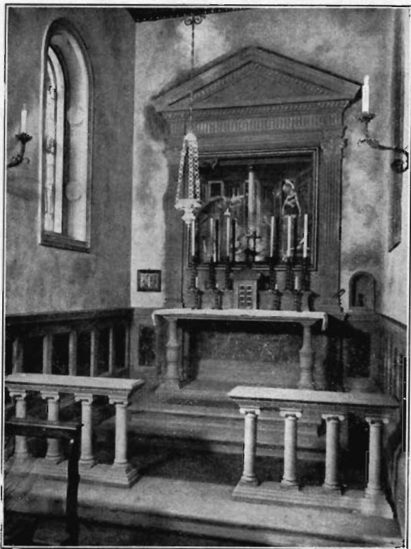
Fig. 2. — Tavernelle (val di Pero): Chiesa di S. Lucia al Borghetto. Cappella della SS. Annunziata.