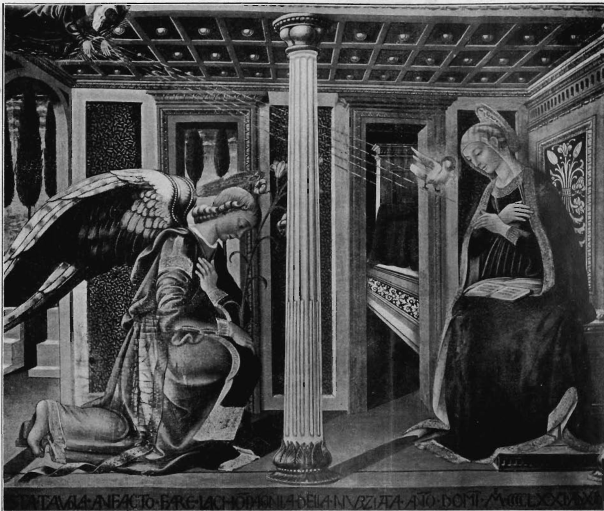
Fig. 1. — Tavernelle (val di Pero): Chiesa di S. Lucia al Borghetto. Cappella della SS. Annunziata.