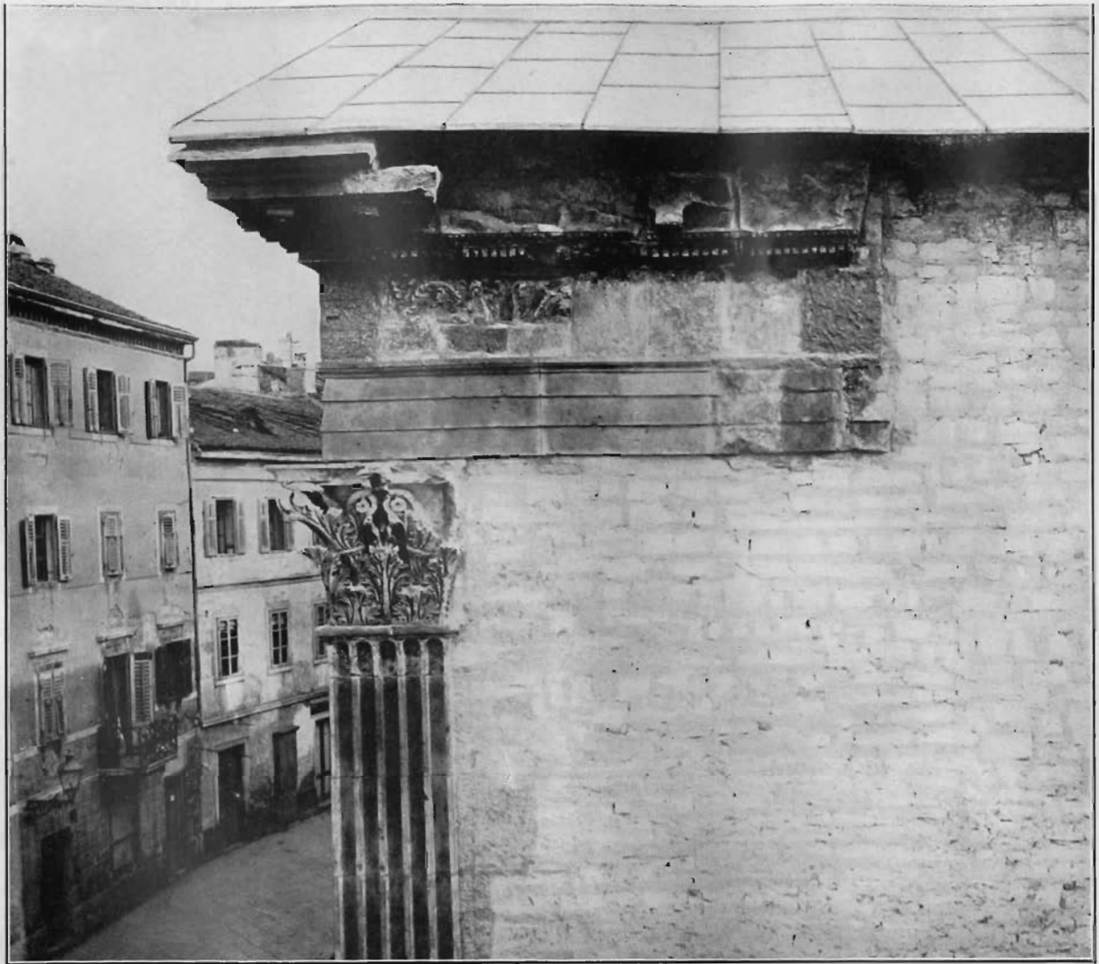
Fig. 2. — Pola: Tempio di Augusto - Fianco occidentale dopo il restauro.