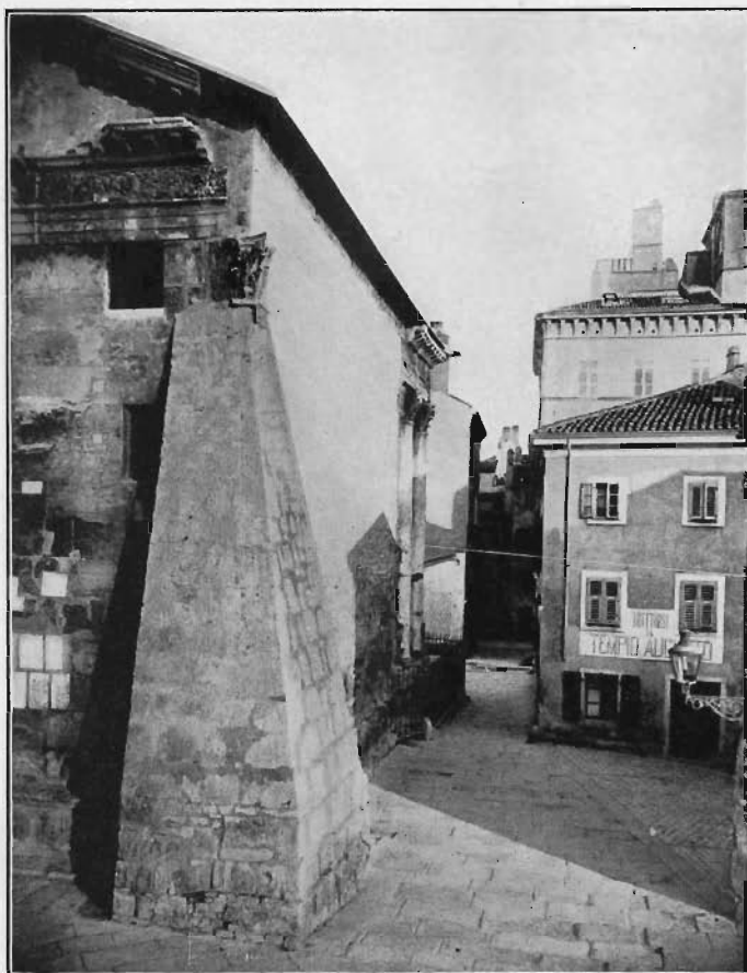
Fig. 1. — Pola: Tempio di Augusto con lo sperone ora demolito.

tura che legasse insieme i due lati e permettesse di iniziare con tutta sicurezza per l'edificio la demolizione dello sperone.