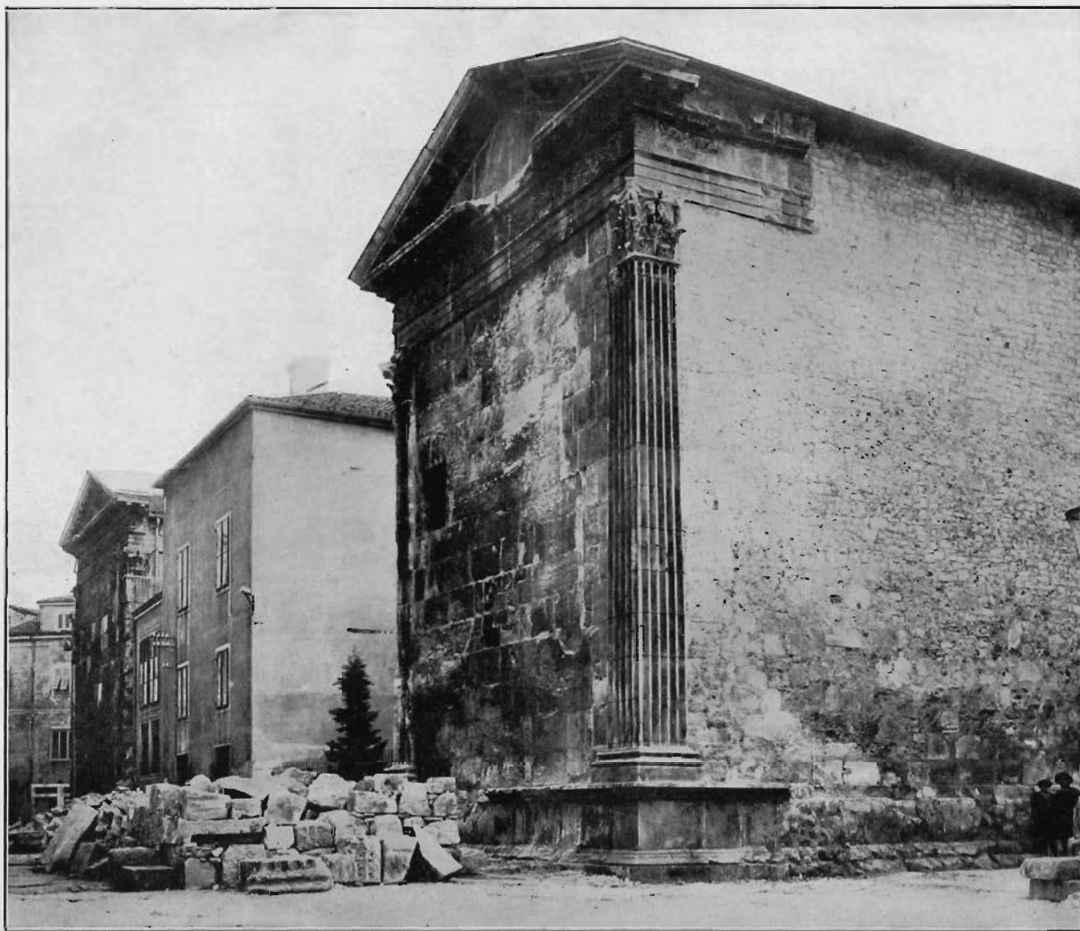
Fig. 5. — Pola, il Tempio di Augusto dopo i restauri.