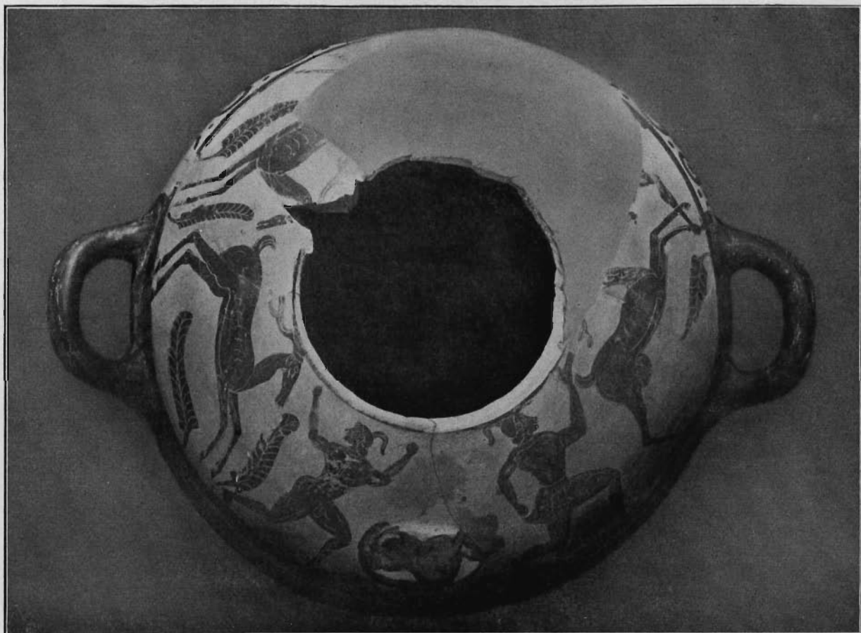
Fig. 2. - Parte superiore del vaso.

della fascia ondulata, e soprattutto dalle figure dei Pegasi al passo. Una caratteristica di quest'arte d'imitazione, è la predilezione per le figure alate: oche o cigni, poi sfingi, arpie-sirene, cavalli, più raramente donne e uomini alati, certo di natura divina (6) . La maniera schematica come sono eseguite le ali di tutte queste figu-